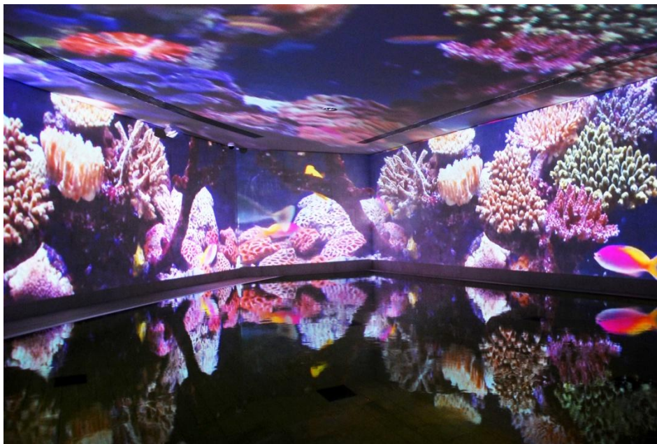
Soletherme Bad Elster, Licht- und Klangbad