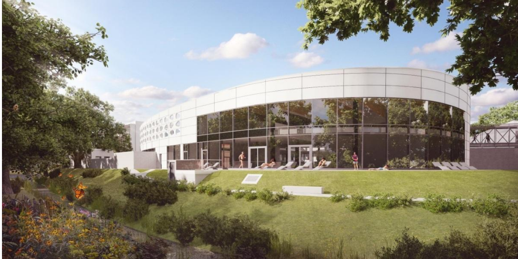
Außenansicht Soletherme Bad Elster