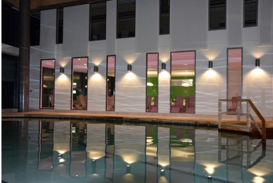
Soletherme Bad Elster, Indoor-Salzsee am Abend

Sächsische Staatsbäder GmbH BAD ELSTER & BAD BRAMBACH